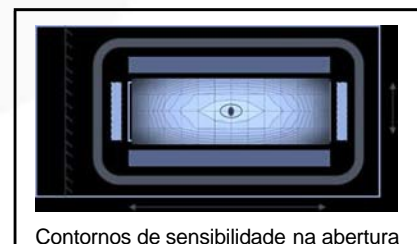
Contornos de sensibilidade na abertura