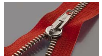
Acabamento de metal aprovado

Encontrando o metal certo: Técnicas de processamento de sinal de 'detecção de fase' possibilitam o software da máquina a distinguir entre diferentes tipos de metal. Isto significa que a máquina é capaz de detectar pequenos fragmentos de agulhas quebradas, ignorando, ao mesmo tempo, outros metais incluindo zíperes não ferrosos, tachas e acessórios.