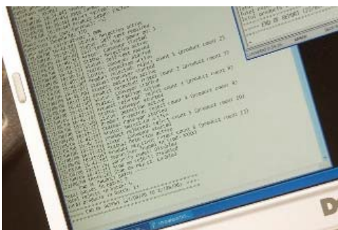
Relatório de Produção