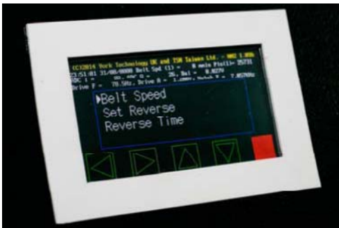
Velocidade da Correia e Opções de Inversão