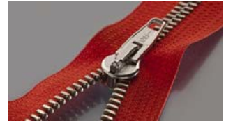
可通过检测的金属镶边

寻找正确的金属： “相位检测”信号处理技术使机器的软件能够对不同类型的金属进行区分。这意味着它能够检测断针的小碎片，而忽略其他金属部件，包括非铁拉链、螺柱和配件。