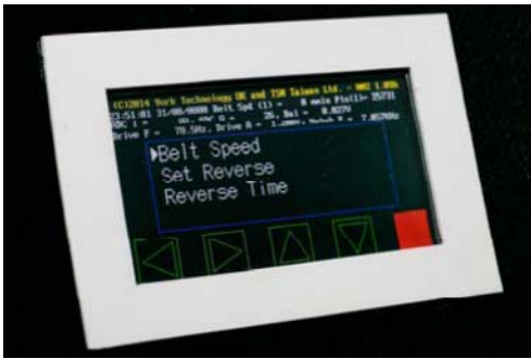
输送带速度和反转选项