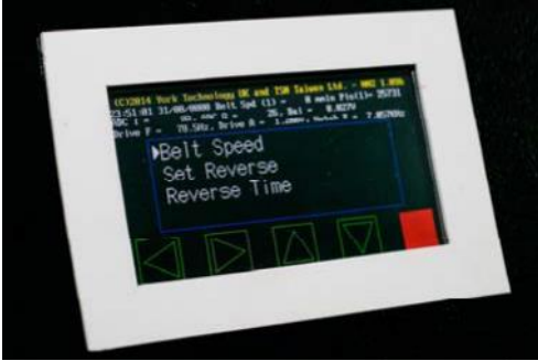
Opciones de reversa y velocidad de la banda