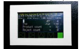
Evento de detección