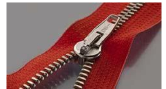
Ornamento de metal aprobado

Encontrar el metal correcto: Las técnicas de procesamiento de la señal de "detección de fase" permiten al software de la máquina distinguir entre diferentes tipos de metal. Esto significa que es capaz de detectar pequeños fragmentos de agujas rotas, mientras omite otros metales como los de las cremalleras sin contenido ferroso, botones y accesorios.