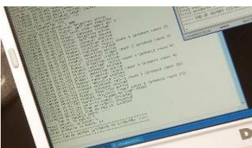
Informe de producción